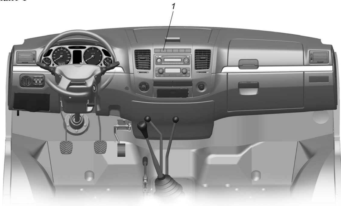
Рис. 5.1. Панель приборов и органы управления 1 – переключатель вида топлива.