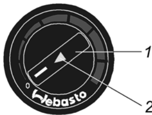
Рис. 8.1. Переключатель управления воздушным отопителем: 1 – ручка; 2 – индикатор работы отопителя

Примечание. Устройство и особенности эксплуатации воздушного (автономного) отопителя, его возможные неисправности, техническая характеристика и гарантийные обязательства приведены в инструкции (руководстве) на воздушный отопитель, прикладываемой к автомобилю.